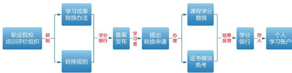
图 实施办法流程图